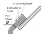
Схема крепления / подключения