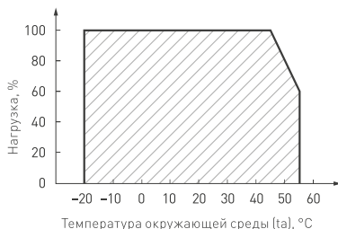
Рис. 3. Максимальная допустимая нагрузка, % от мощности источника