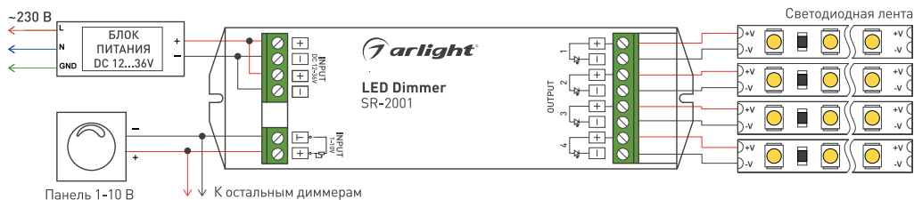
Рис. 1. Схема подключения SR-2001.