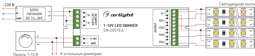
Рис. 2. Схема подключения SR-2001EA.